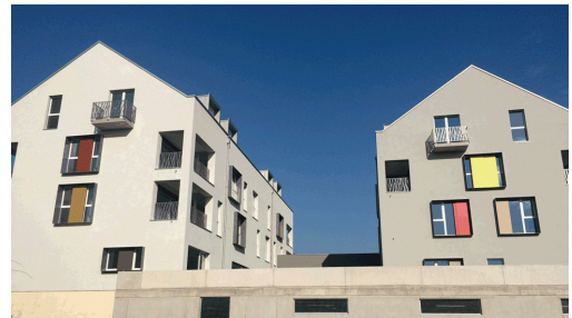
Les immeubles d'Echallens vus depuis l'arrière