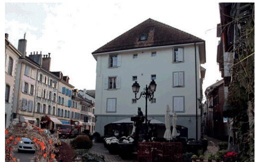
Le bâtiment nouvellement acquis à Morges