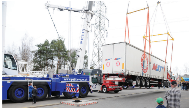
Un camion semi-remorque suspendu à deux grues: l'outil de communication de Petit Levages pour sa journée portes ouvertes en 2015.

Une expérience précieuse, car elle permet une évaluation plus juste des risques. Chez Petit Levages, nombreux sont les conducteurs de grues à avoir entre 20 et 30 ans de maison. Malgré des horaires et un rythme parfois éprouvant, ces derniers sont des passionnés. Il y a le plaisir de faire corps avec engins titanesques, maniés au centimètre près. Et celui d'avoir des journées aussi variées que ce qu'une grue peut porter.