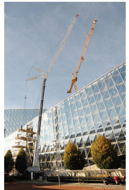
Le chantier du nouveau siège de «JTI» Japan Tobacco International à Genève (Sècheron).